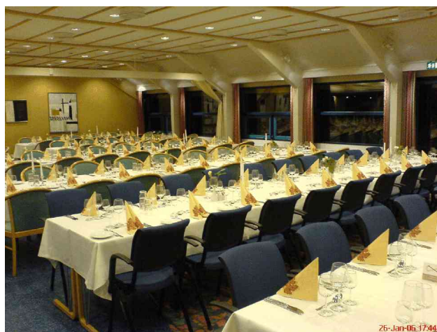
Klar til festmiddagen hvor vinderne af firma-konkurrencen blev præmieret. Efterfølgende var der dans til levende musik

Torsdag morgen gennemførtes Dansk Radiologisk Selskabs 1. motionsløb , i det sneklædte landskab langs åen i Odense. Temmelig glat, men flot. Hvor mange deltog mon? Se svaret på bagsiden.