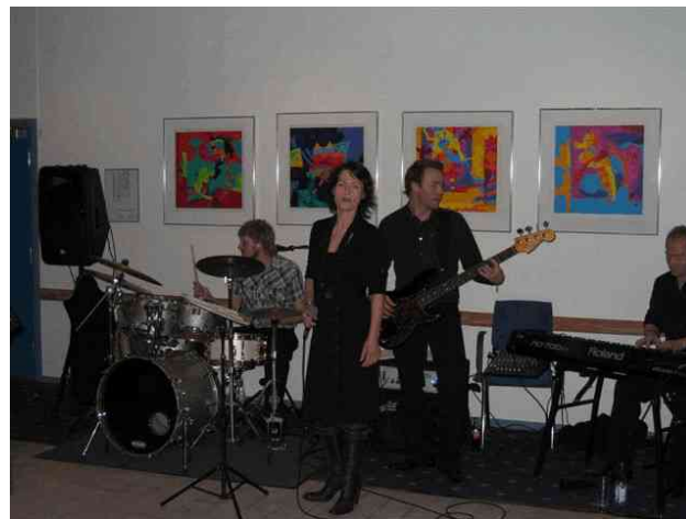
Orkestret som spillede op til dans efter festmiddagen torsdag aften