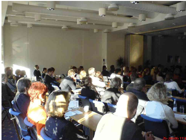
Der var godt fyldt til alle sessioner