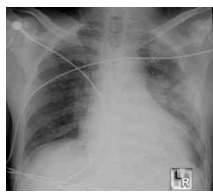
lungekontusion (bemærk ribbensfrak- turerne)