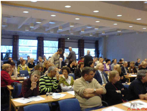
Salen fyldes, ca. 150 kunne der være i salen