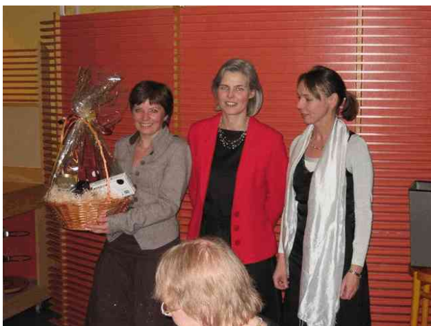
Uddeling af præmier foregik til festmiddagen, her til vinder af FYR-konkurrencen

Torsdag morgen gennemførtes Dansk Radiologisk Selskabs 1. motionsløb , i det sneklædte landskab langs åen i Odense. Temmelig glat, men flot. Hvor mange deltog mon? Se svaret på bagsiden.