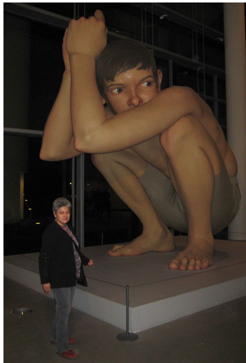
Besøg på kunstmuseet AROS

Næste Årsmøde: 26-28. januar 2011 i Odense