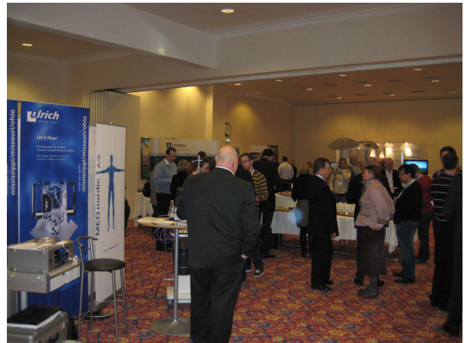
Dansk Radiologisk Selskabs medlemsblad nr 1/2010 - maj 2010